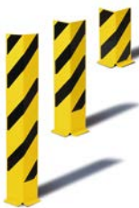
Protector de estantería