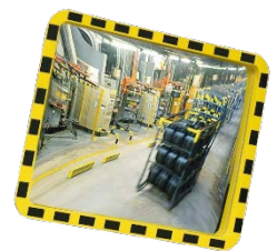
Espejos de vigilancia