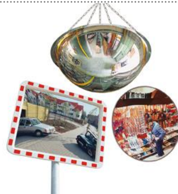
Espejos de Seguridad