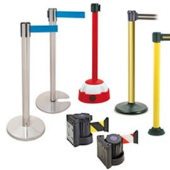
Delimitadores de Espacio