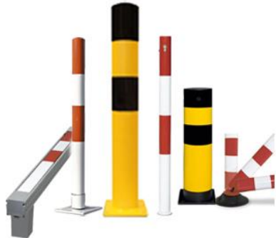
Pilonas y Bolardos